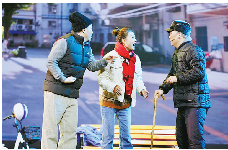
小品《我们的小亮》剧照。

本报讯（记者廖惠兰）在近日落幕的第十六届华东六省一市戏剧小品大赛中，宁波选送的两件作品获奖，其中鄞州区文化馆创作的小品《我们的小亮》捧回大奖，北仑区文化馆创作的小品《共享奶奶》获得银奖。