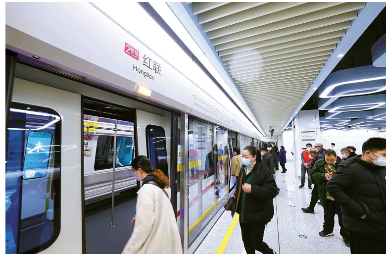
从红联站坐地铁到招宝山站，两分钟就到了。