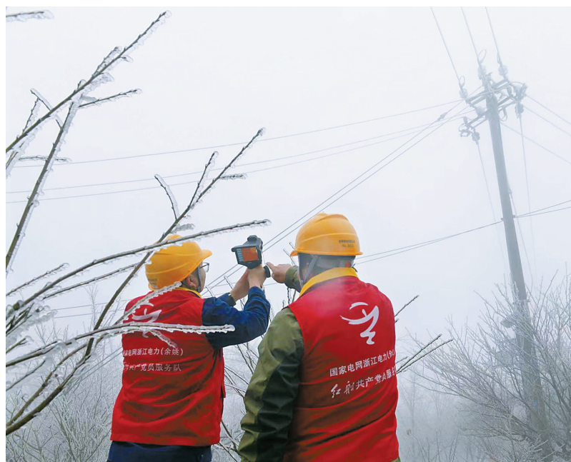
输电人员对供电线路进行检查。

此外,国网余姚市供电公司已完成了区域内24座变电站、35条重要输电线路的特巡工作,并组建了13支抢修队伍、共计600余名抢修人员。