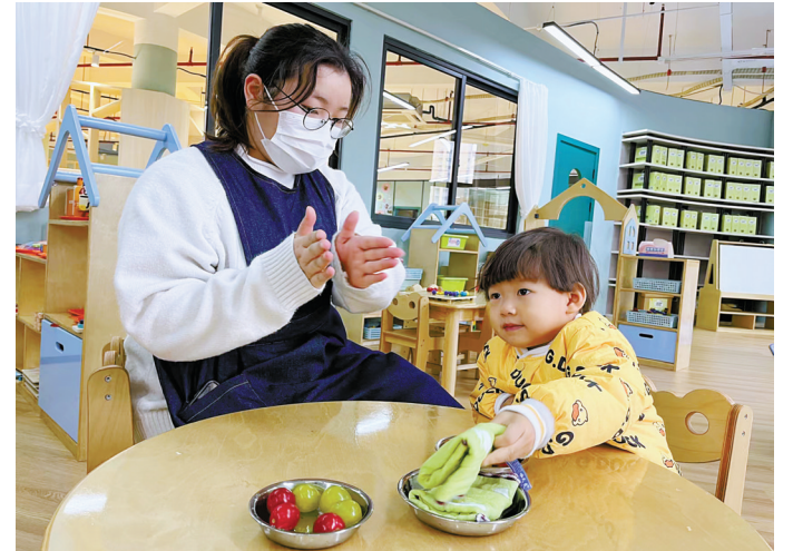
吾幼托育所工作人员照顾幼儿。