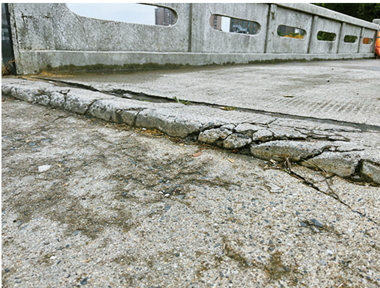
桥头处有明显高落差。

为督促村里解决该问题，今年11月，何先生于7日、11日、21日、25日4次发帖。对此，云龙镇最近一次于11月16日答复：该处为村道，修缮与否及资金都由村决