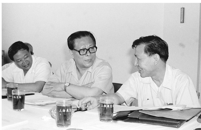
上图：1985年，江泽民同志在上海市八届人大四次会议上。