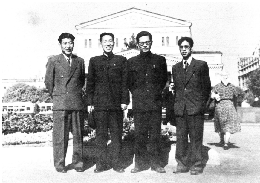
上图：1955年至1956年，江泽民同志（右二）曾在莫斯科斯大林汽车制造厂实习。这是江泽民等在莫斯科合影。