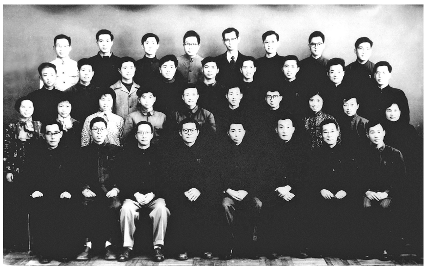
上图：1963年3月，江泽民同志（前排右五）在上海同小型三相异步电机全国统一系列设计领导小组成员合影。