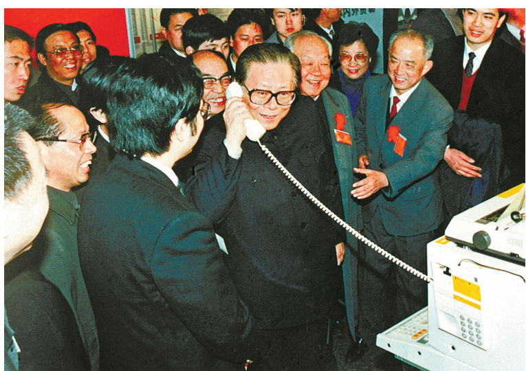
上图：1984年5月，江泽民同志在北京展览馆举行的全国电子产品展览会上，试用国际长途电话向远方的工作人员问候。