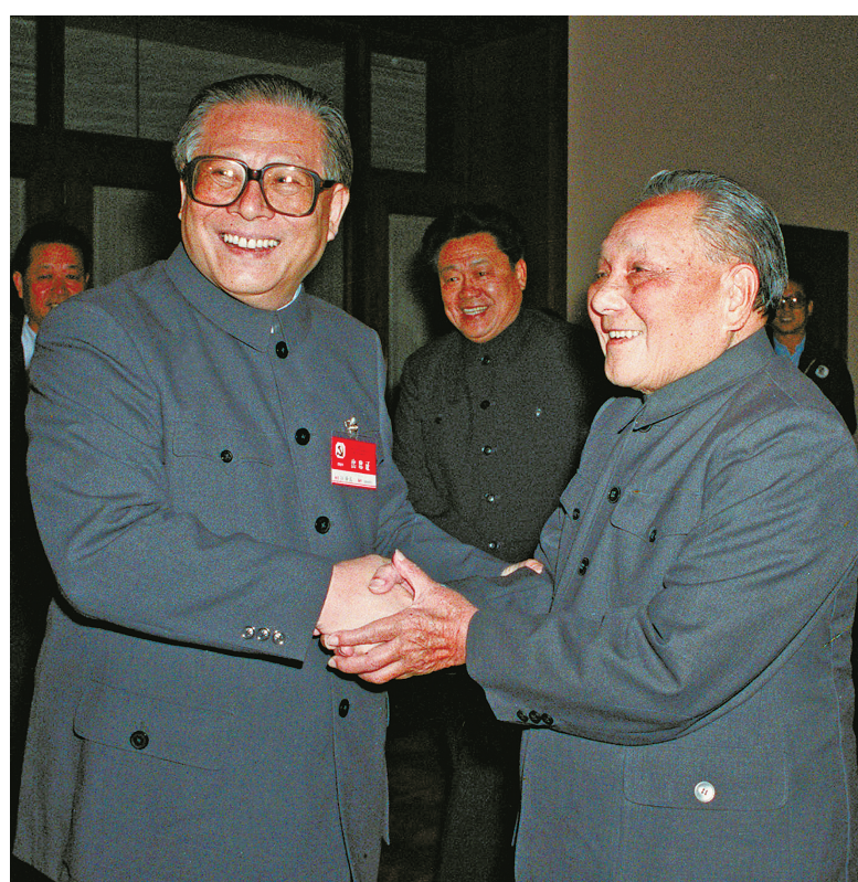
右图：1989年11月6日至9日，中国共产党第十三届中央委员会第五次全体会议在北京召开。这是邓小平同志和江泽民同志亲切握手。