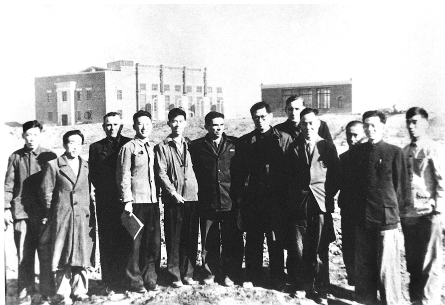
上图：1956年，江泽民同志（左七）在长春第一汽车制造厂同援建一汽的苏联专家等合影。