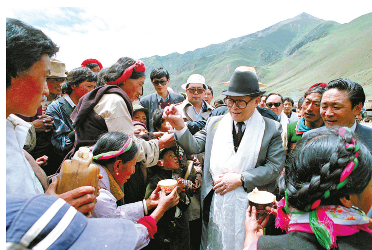
上图：1990年7月25日，江泽民同志与藏族群众共庆望果节。