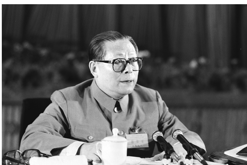
上图：1989年6月23日至24日，中国共产党第十三届中央委员会第四次全体会议在北京召开。这是江泽民同志在会上讲话。