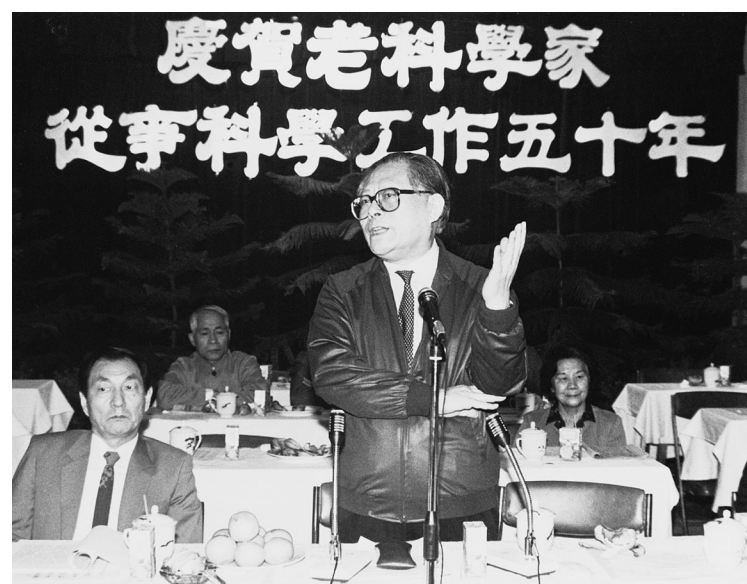
上图：1988年10月，江泽民同志在上海庆贺老科学家从事科学工作五十年座谈会上讲话。