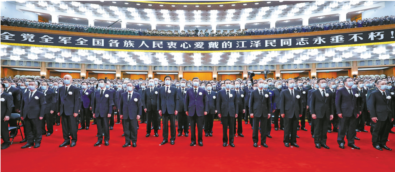
12月6日，中共中央、全国人大常委会、国务院、全国政协、中央军委在北京人民大会堂隆重举行江泽民同志追悼大会。习近平、李克强、栗战书、汪洋、李强、赵乐际、王沪宁、韩正、蔡奇、丁薛祥、李希、王岐山等参加大会。