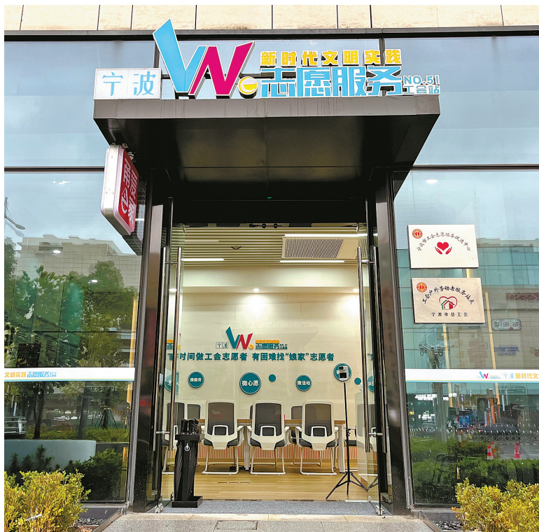
宁波市新时代文明实践志愿服务We站·51号工会站。

与此同时,“甬工益”还创新推出关爱户外劳动者、奉献亚运·志愿同行、学雷锋暖人心、抗疫有我、深情诵读·献礼“红五月”、助农促共富、助力防汛防台等主题活动,接地气、受欢迎、成效显著,充分发挥了工会“娘家人”的志愿服务力量。