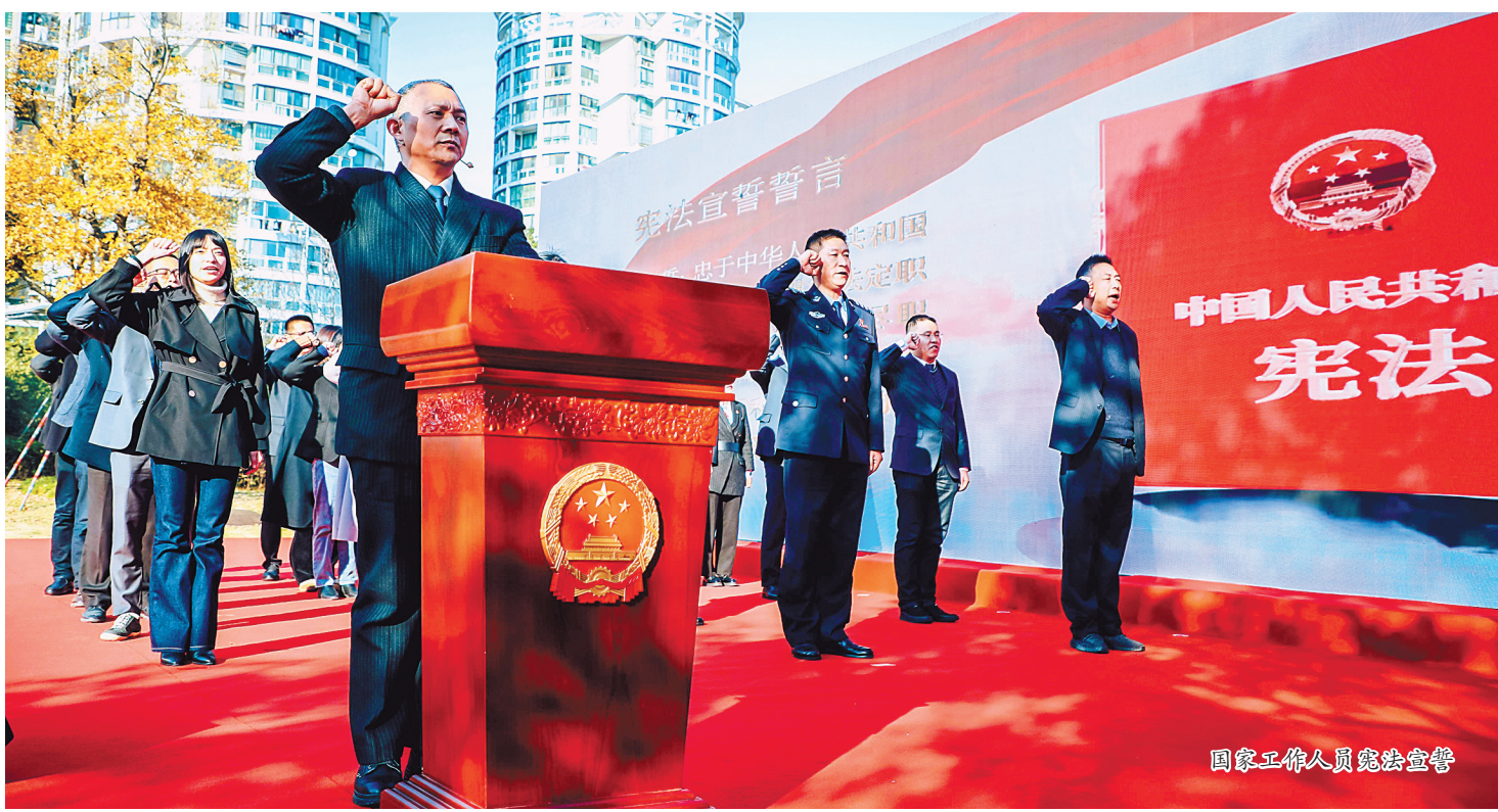
国家工作人员宪法宣誓

近年来，我市坚持守正创新，围绕习近平法治思想、宪法、民法典、法治乡村建设等重点领域、重要法律，加大全民普法力度，不断提高普法针对性和实效性，着力提升公民法治素养，涵养崇法向善的社会风尚，努力开创全市“八五”普法工作新局面，为推进法治宁波、法治政府、法治社会一体建设夯实基础，为加快建设现代化滨海大都市营造良好的法治环境。