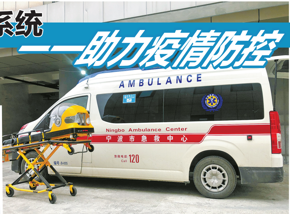
▲ 负压救护车。 ▲ 高效负压隔离头罩。