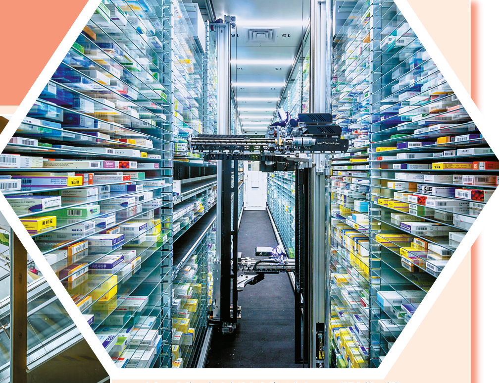
▲新一代药品自动存储分发管理系统。

“我遇见最美的光,用微弱星火汇聚成万丈光芒,一袭白衣,一身责任,提起明灯盏,守护生命长青……” 近日,由宁波市摄影家协会、宁波市第一医院工会联合主办的“我遇见最美的光”宁波摄影名家走基层活动,走进宁波市第一医院方桥院区,在光影中记录我市医疗事业发展成就和默默奋战在救死扶伤、抗击疫情一线的白衣天使。 今年6月30日正式启用的宁波市第一医院方桥院区是省、市两级重点工程项目,总投资超过32亿元,总建筑面积达到42万平方米,规划床位2650张,是宁波市规模最大的单体院区。 宁波市第一医院方桥院区作为宁波市“医学高峰”计划的标志性工程,旨在建成浙江省最大的一体化急危重症医学中心、省级医学综合研究创新平台、数字化改革示范性省区域医疗中心。