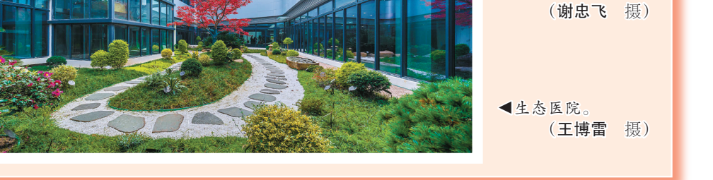
▲生态医院。