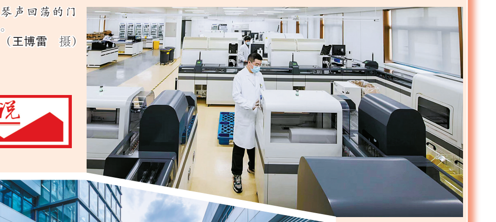
▲全自动检测流水线高效运行。