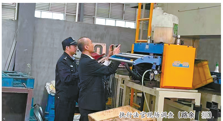
执行法官现场调查

在此次专项执行行动中，宁波法院创新执行机制和执行方法，用足用好罚款、拘留、限高失信、追究拒执等强制措施，坚持疫情防控、案件执行两手抓，坚持强制执行、善意文明执行两手硬。宁波法院将持续深化“为群众办实事示范法院”创建活动，积极开展“五问五破、五比五先”机关作风专项活动，深入学习宣传贯彻党的二十大精神，以执行干警的辛苦指数换取人民群众的幸福指数，努力让人民群众在每一个司法案件中感受到公平正义。