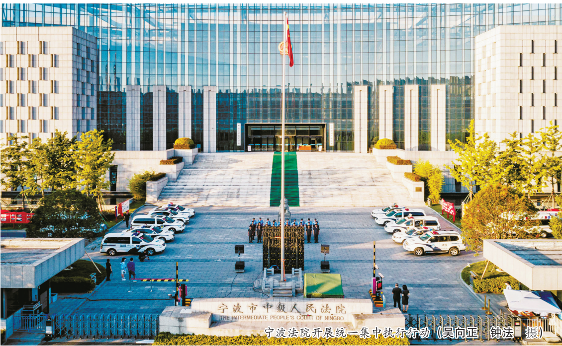
宁波法院开展统一集中执行行动