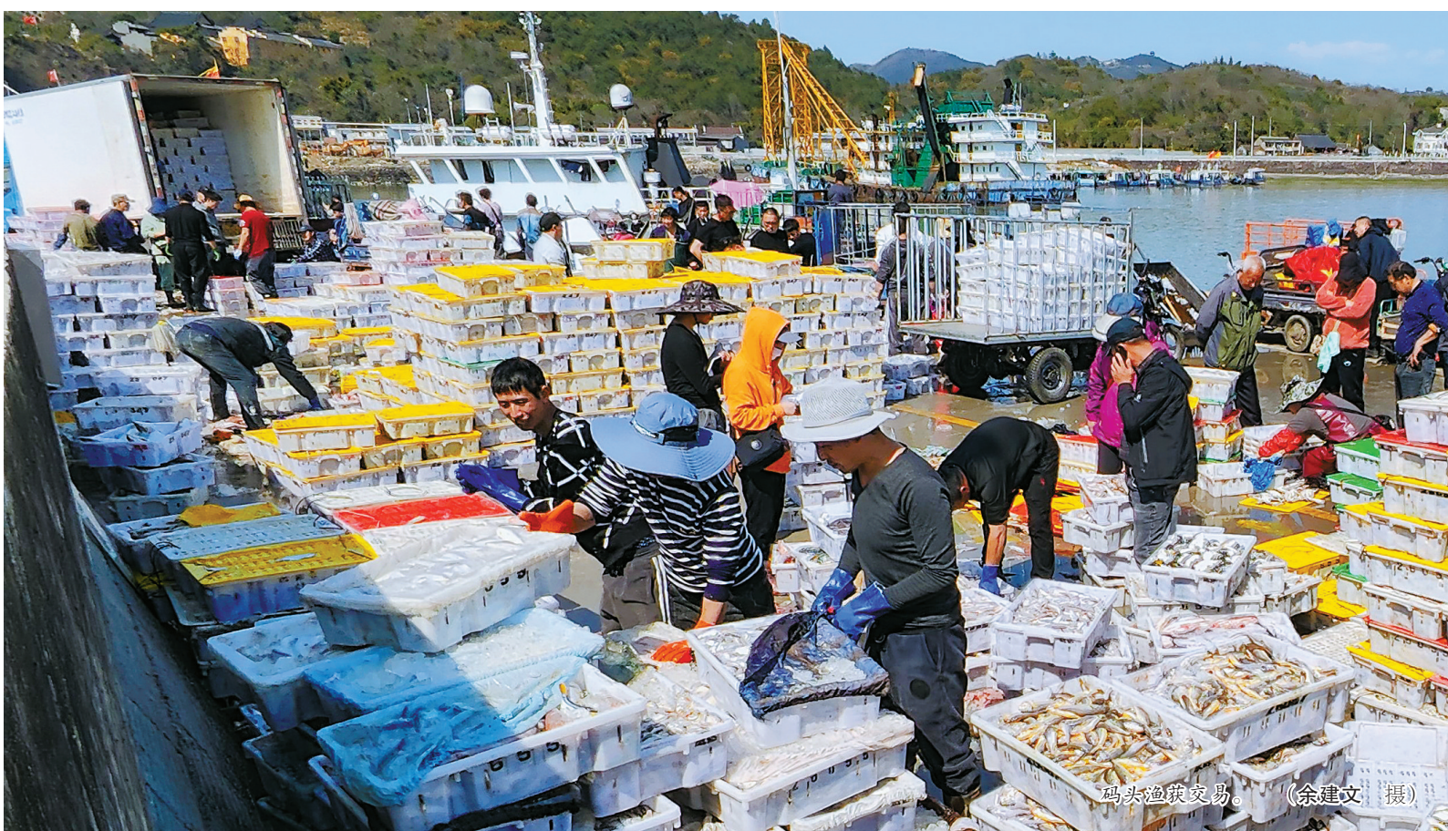
码头渔获交易。

每到初冬，海里的黄鱼、带鱼等鱼群由北向南洄游，也是海洋捕捞的作业高峰期。码头上，渔运船载着新鲜捕捞的渔获返回渔港，渔民分级分类挑选，送往市场销售。