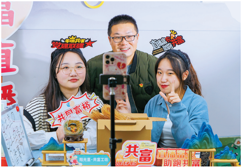
观岭六村共富推荐官在“零碳共富直播间”直播带货。

据介绍，高山“红圈”分“红内服务圈”和“红外服务圈”。其中，“红内服务圈”凝聚辖区各单位、部门资源，组建了高山人大联络、村务协商、医疗服务、代办便民、应急救援、红色宣讲、亲情志愿、