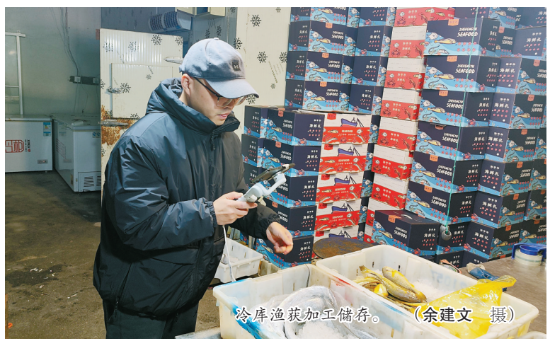
冷库渔获加工储存。

“捕鱼靠天吃饭。因为海洋资源萎缩，这几年鱼越来越难捕，偶尔碰到‘大网头’，全靠运气。”邵盛波说，莼湖的渔船基本上是拖网作业，以捕捞黄鱼、带鱼、鲳鱼、马