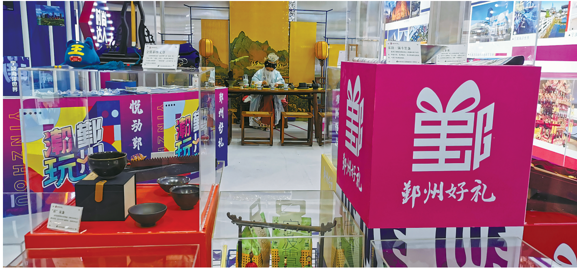
各地纷纷推出独具特色的文旅融合产品参展。