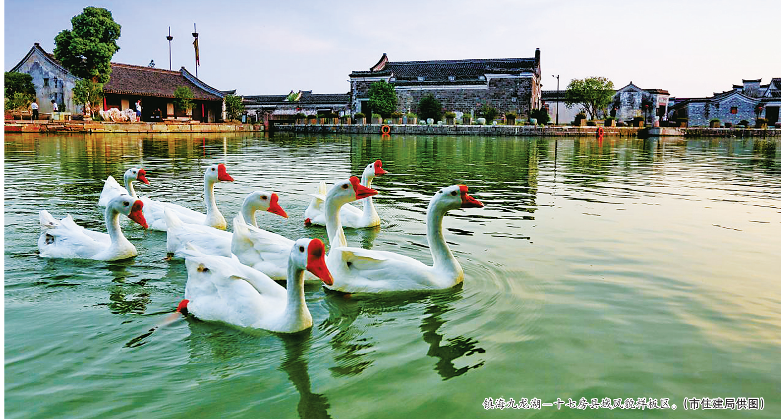
镇海九龙湖一十七房县城风貌样板区。

本报讯(记者徐卓蔚 通讯员孙佳 袁惠银)省建设厅22日发布浙江省2022年度第三批城乡风貌样板区名单,宁波5个样板区入围,分别是宁海前童—岔路县域风貌样板区、余姚四明之窗红诗路县