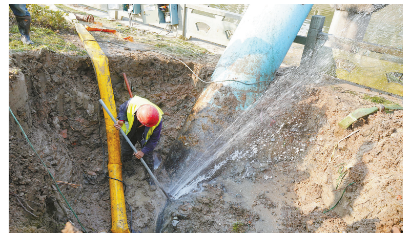
管道工在抢修供水管道。

市水务环境集团特别提醒,市民可以关注“宁波水务环境”微信公众号,通过网上营业厅在线办理各项业务,也可以拨打24小时清泉热线96390进行咨询。