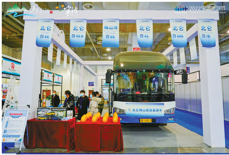
后疫情时代,本地及周边游成为旅游复苏的“主阵地”。

展的民宿与酒店。在民宿展区,海曙龙观禅那、象山潮烟里、慈溪丹橘山房、宁海前童驿事、钱湖1936等精品民宿现场发放的优惠券和伴手礼被观众“秒抢”,春节期间的床位更是早早预订出去,“估计一成不到的余位也会在月中下旬被预订一空”。