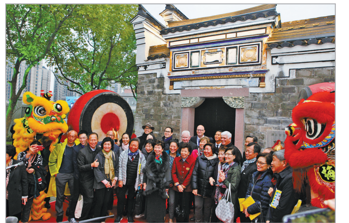
包玉刚故居开馆仪式

包玉刚故居是宁波帮建筑的典型代表之一，2017年被浙江省人民政府列为省级文物保护单位。作为宁波帮的杰出代表，“世界船王”包玉刚在这里出生、成长。为了充分保护和阐释包玉刚故居作为宁波帮文化遗产的价值内涵，宁波帮博物馆于2018年对故居建筑开展专业性修缮，在保护原有历史风貌和建筑格局的基础上，更新完善了各项软硬件设施，并融入了主题鲜明的展览，通过“包氏一脉”“船王之路”“厚德传世”系统展示包玉刚的生平事迹，展现包氏家族传承的优良祖训家风。包玉刚故居的修缮启用和主题馆开馆，不仅得到了包玉刚家族后人和海内外包氏亲属的认可，还获评国家3A级旅游景区，成为众多甬城市民参观、打卡的目的地，是基于名人故居进行宁波帮文化遗存阐释的一次成功尝试。