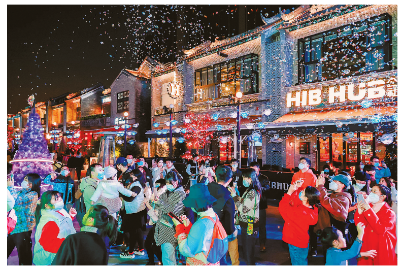
游客在广州天德广场游玩（2023年1月1日摄）。元旦假期期间，广州市各大商圈、文化旅游场所打折促销、游园集市、潮流夜市等活动纷呈，消费市场有序恢复，夜经济稳步复苏。