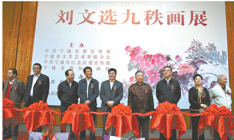
2012年，90岁的刘文选(右四)在宁波美术馆举办“九秩画展”展出其国画作品168幅。

本报讯(记者黄银凤)昨晚，我市著名画家、美术教育家刘文选先生在宁波逝世，享年100岁。