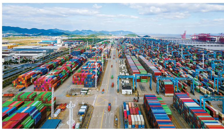
1月10日，梅山港区内龙门吊抓举、集卡穿梭，码头作业繁忙不已。