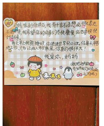
女儿写给护士妈妈的信。

后,便不吃不喝不上厕所,直到下一批人来顶班。 科主任杜学宏和护士长周慈霞每晚七八点才回家,周护士长的孩子马上就要高考了,丈夫感染了新冠病毒高烧在家,但是她完全顾不上家里,日日早出晚归。她说:“科室里每个人都很不容易,每个人都是克服了重重困难,也正是因为这样,才让特殊时期的急救工作有了保障。”