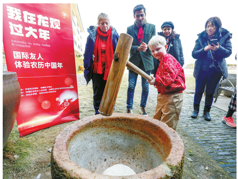
外国友人在体验春年糕。

剪窗花、春年糕、汉服体验、围炉煮茶……春节临近,昨日,在海曙区龙观乡,20余名外国友人齐聚一堂,共同体验中国传统年俗活动,在欢声笑语和浓浓年味中,迎接农历春节的到来。