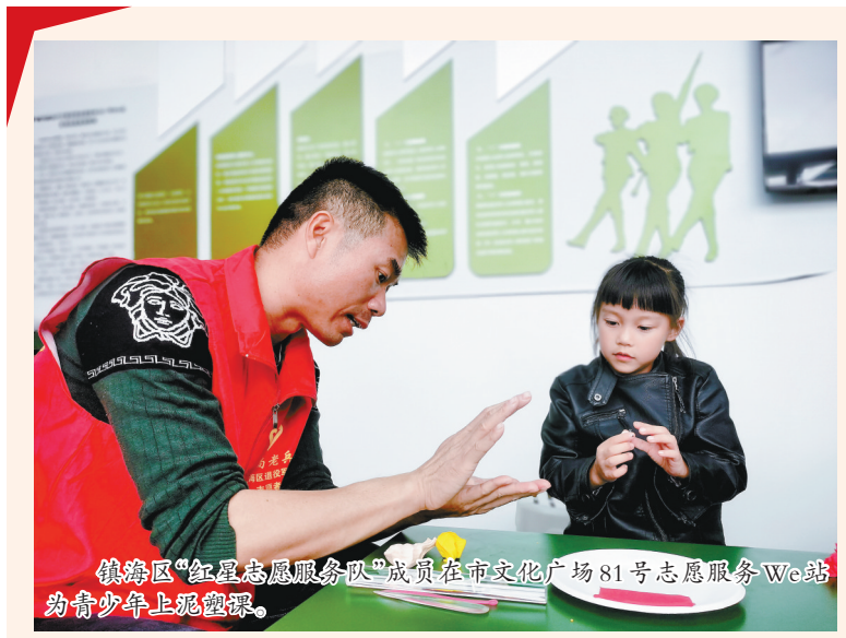
镇海区“红星志愿服务队”成员在市文化广场81号志愿服务We站为青少年上观视频。