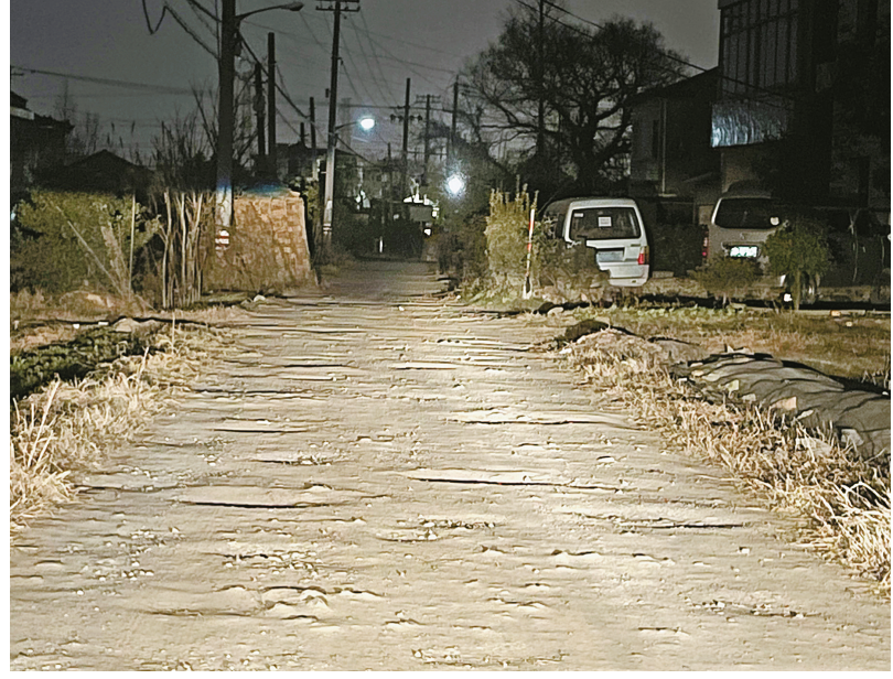
车灯开启后,一眼看不到头的坑洞。

随后,记者又开车体验了这段村道的通行难度。车辆启动时,是一眼看不到头的坑洞,根本没有择