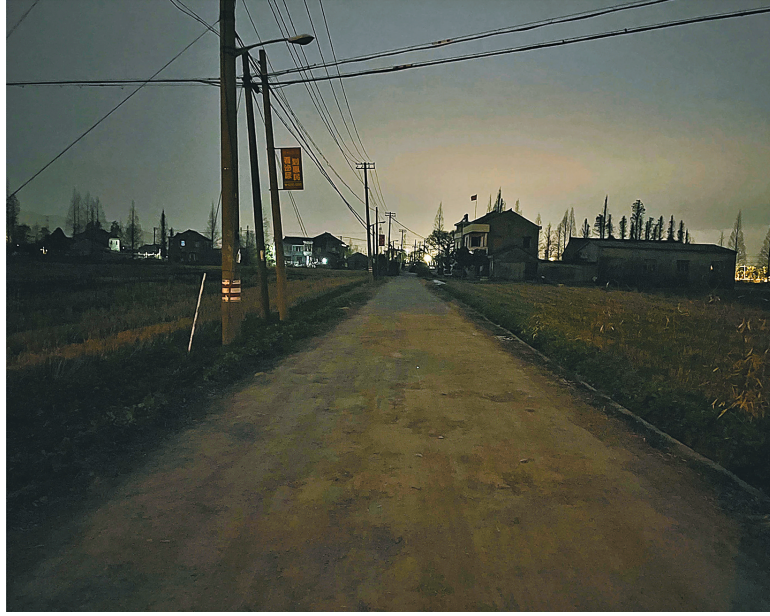
2月2日晚天色昏暗,这段村道因为没有路灯,很难行走。

映的余姚市陆埠镇沿江村上章的路灯问题到现在已有4个多月了,还没有解决,线上答复完后就没下文了吗?现在晚上天黑得快,又经常下雨,村里老年人居多,早晚出行安全隐患较大,请相关部门给出具体安装路灯的时间,不要一拖再拖!