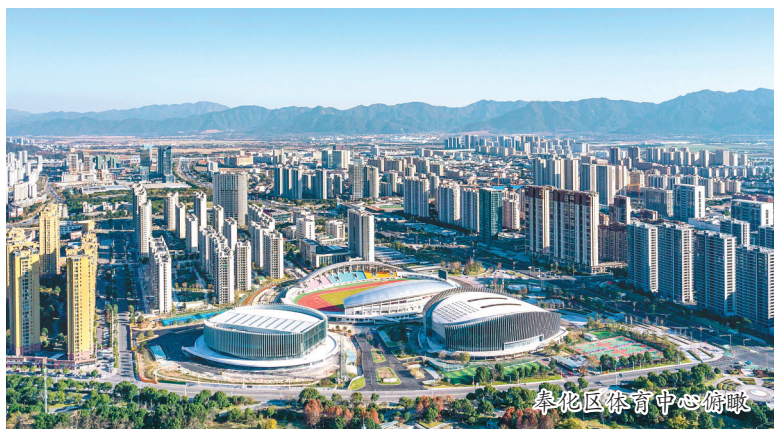
奉化区体育中心俯瞰