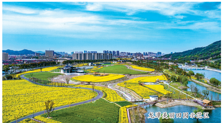
龙潭美丽田园示范区