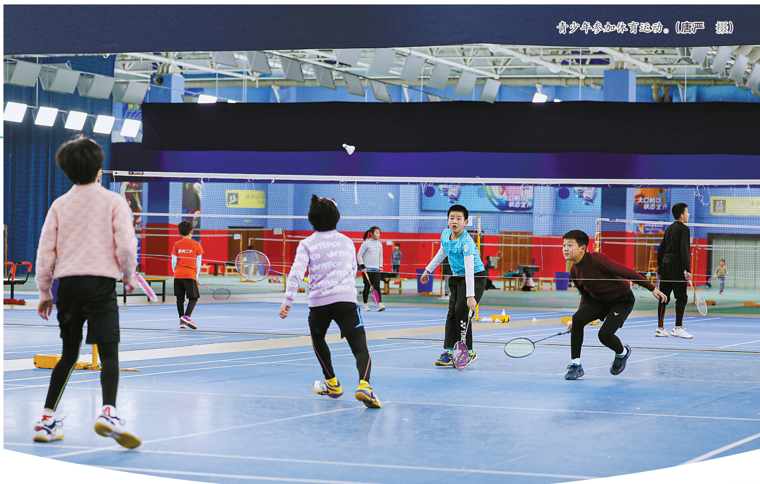
青少年参加体育运动。