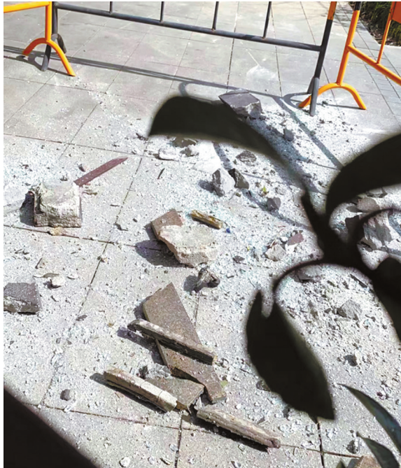
外墙线条砖掉落碎了一地。

府一期物业在现场放置围栏，清理外墙线条砖碎块，张贴提示，防止其他居民靠近，同时将此事反馈给小区开发商，后者立即敦促施工单位安排人员到现场修缮外墙，更换雨棚的玻璃和大理石。