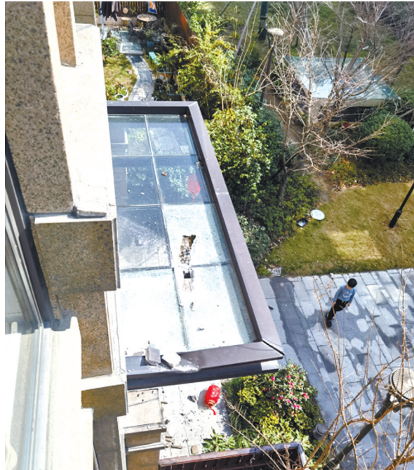
昨天，外墙线条砖从22楼坠下后，砸穿雨棚。