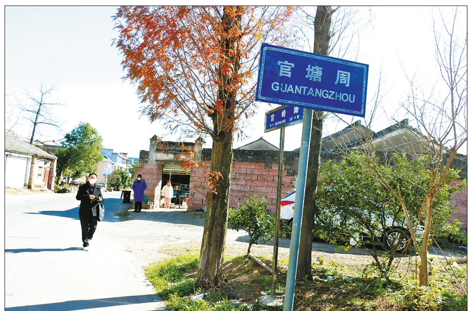
官塘周村

10世纪末至11世纪前期，在中日交往史上涌现出了一批宁海商人，他们以周文裔、周良史父子为代表，多年往返于中日两国间，他们的事迹作为宋代海外贸易的代表性事例，具有极其珍贵的历史价值。