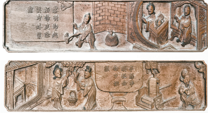
朱子家训 图文(四片)