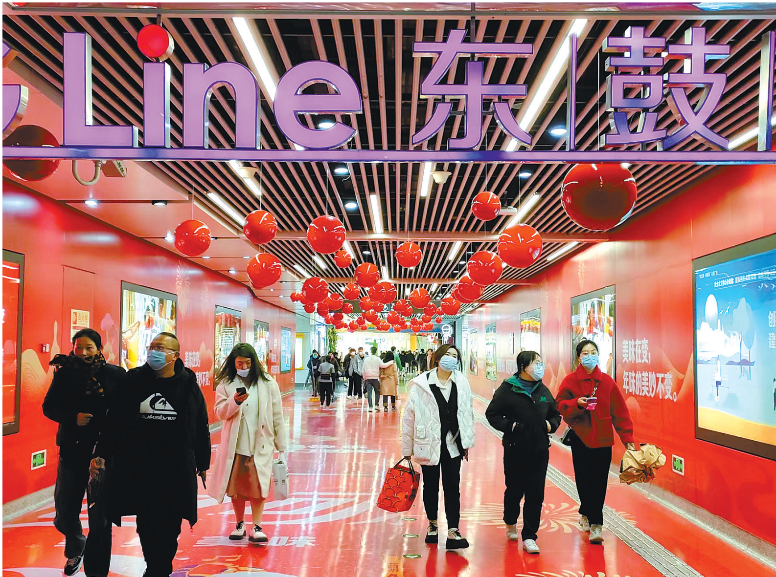
从东鼓道购物后准备坐地铁回家的人们。

地铁经济的红利正在不断释放。2021年度“宁波市十佳最受商业综合体的名单”中，天一广场、和义大道购物中心、宁波万象城、北仑富邦商业广场、阪急百货和世纪东方商业广场均处在地铁沿线。2月14日，阪急百货、富邦广场、天一广场、万象汇等商业体纷纷举办音乐会、气球节等活动，吸引了各路消费者。