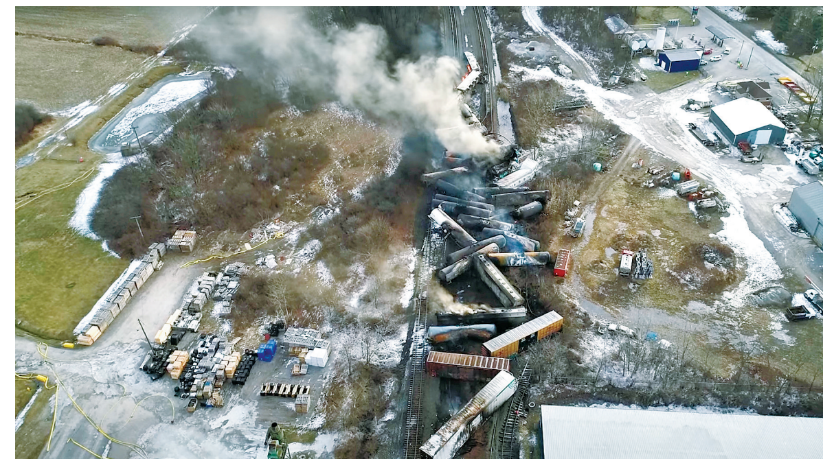
这张美国国家运输安全委员会发布的无人机视频截图显示的是有毒化学品运载列车脱轨事故现场。(新华社发)