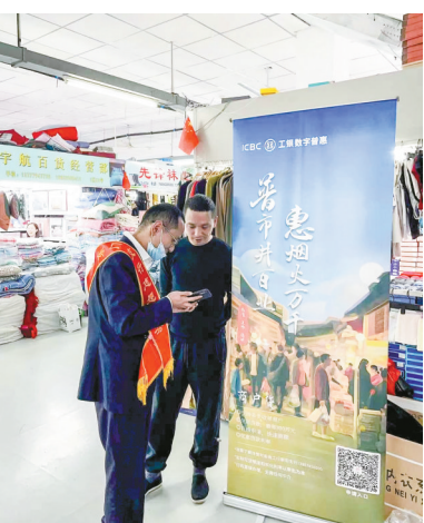
工行宁波市分行推出“商户贷”为小微商户纾困解难。