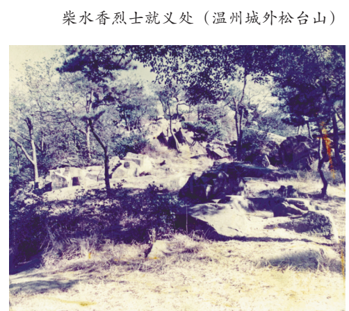
柴水香烈士就义处（温州城外松台山）