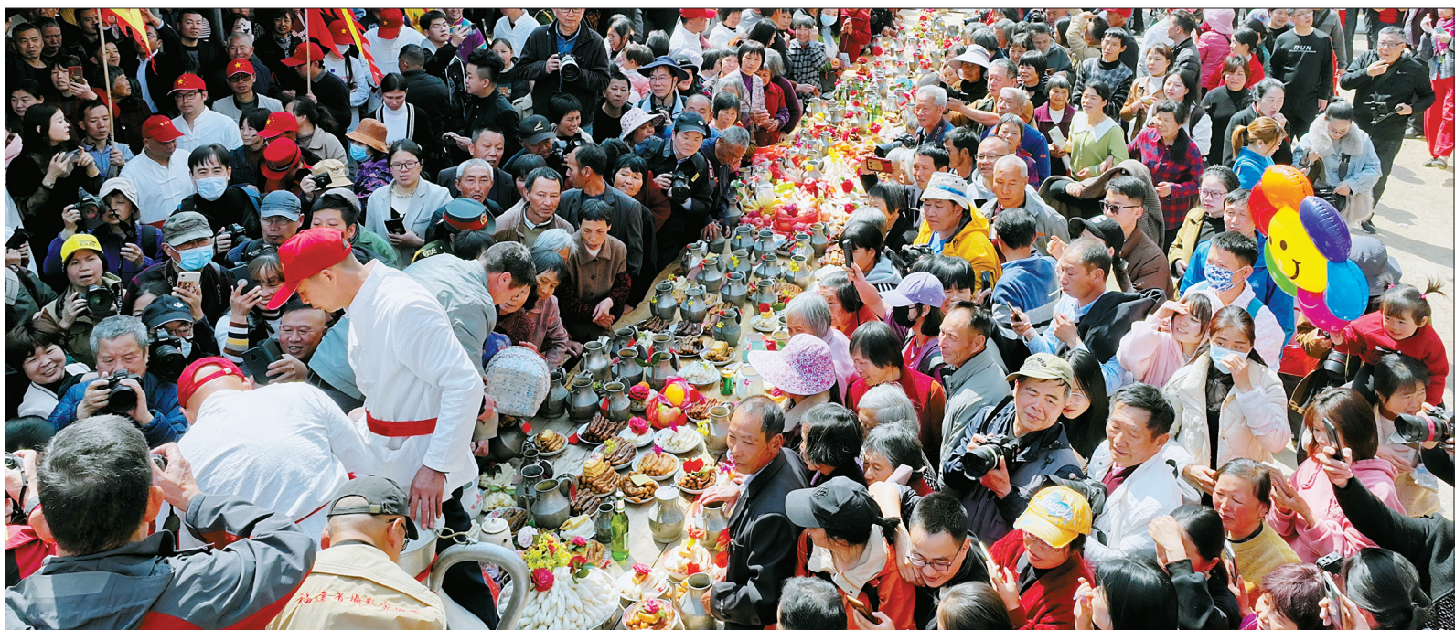
2月21日，在福建省龙岩市长汀县濯田镇升平村，村民们参加“百壶宴”民俗活动（无人机照片）。当日是农历二月初二，是我国民间俗称“龙抬头”的日子，人们在丰富多彩的民俗活动中欢庆传统节日。