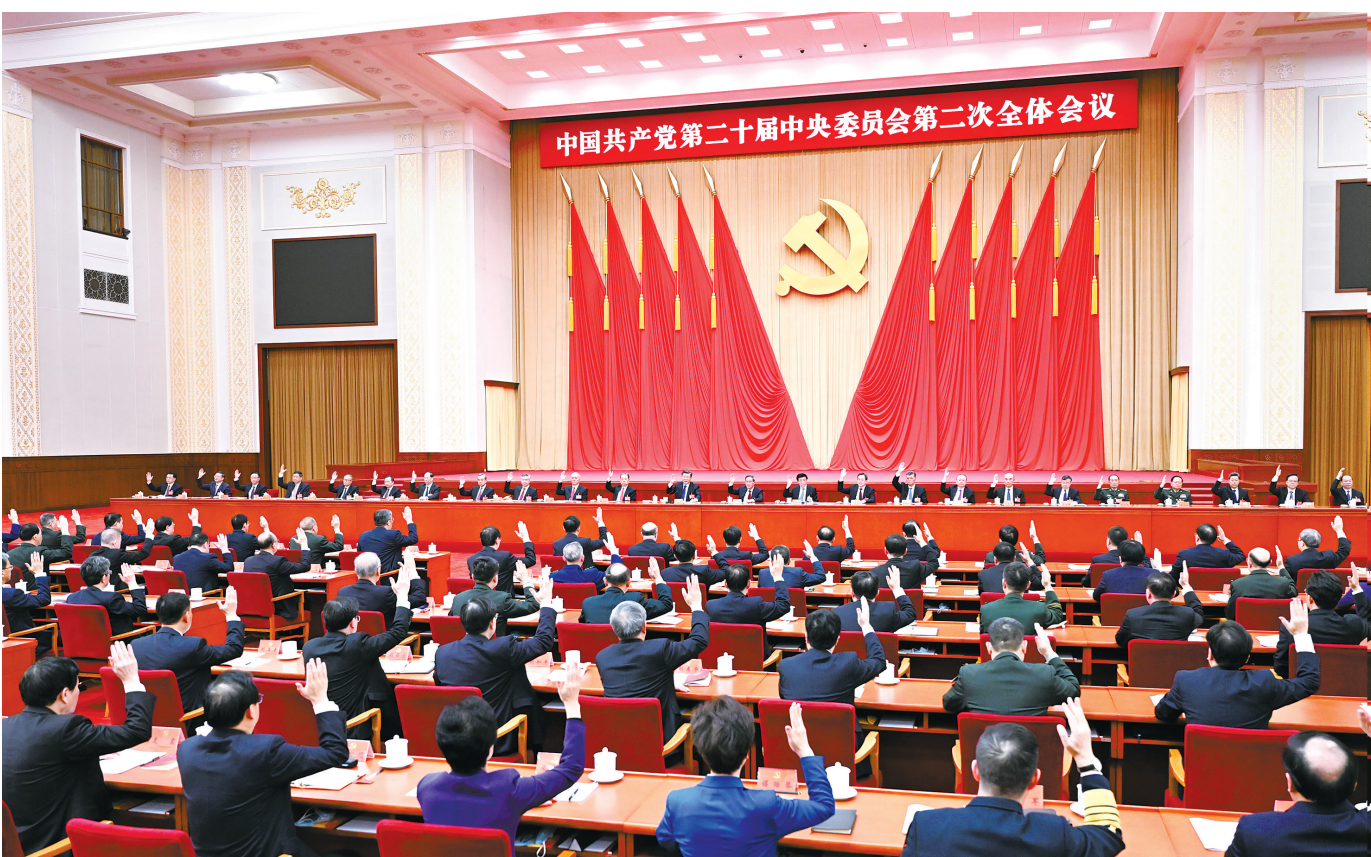
中国共产党第二十届中央委员会第二次全体会议，于2023年2月26日至28日在北京举行。中央政治局主持会议。(新华社发)