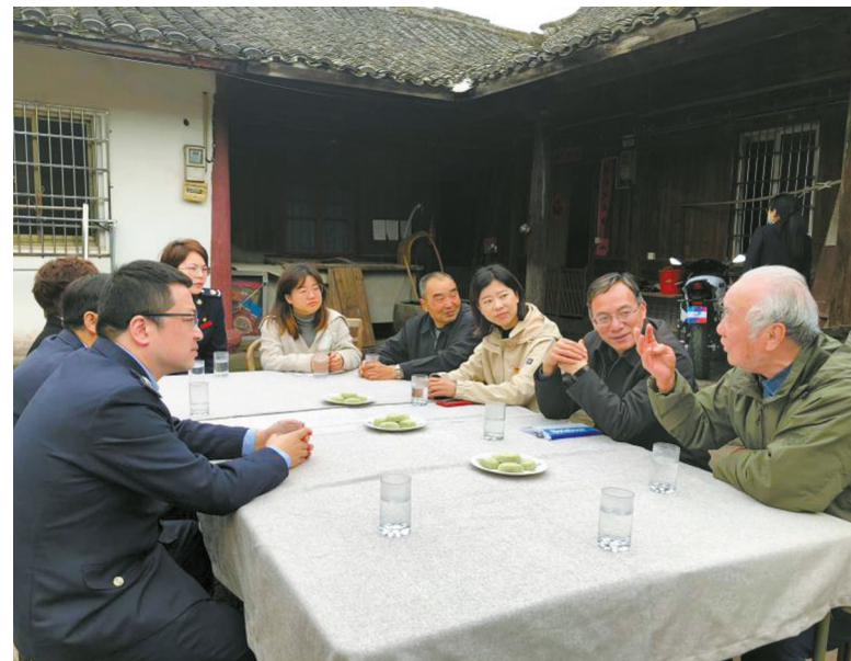
“墙门议事会”气氛热烈。