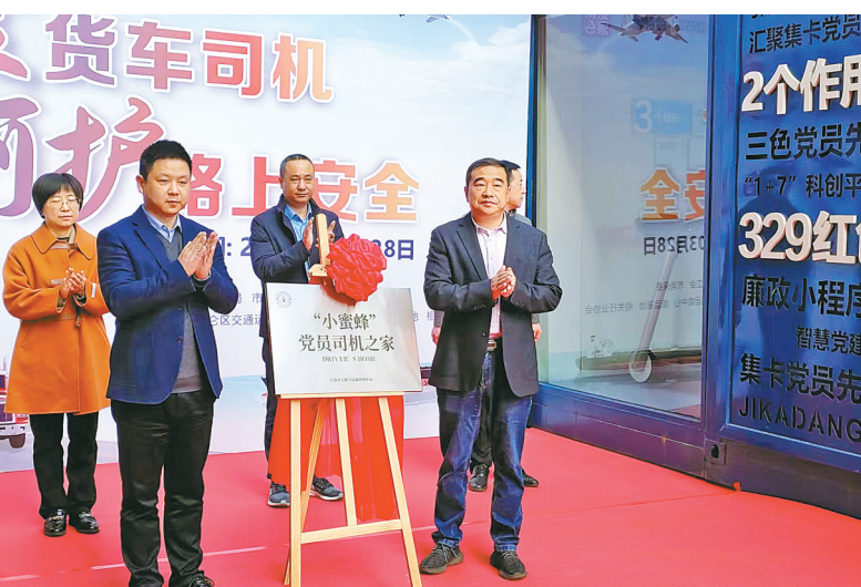
“小蜜蜂”党员司机之家揭牌。

“小蜜蜂”党员司机之家揭牌。 爱活动。昨天上午，“小蜜蜂”党员司机之家在北仑集运基地揭牌，将为集卡司机提供更多暖心服务。 此外，我市积极服务港口物流，在降本减负方面，去年以来，为7.5万余辆营运货车补贴检测费，为3万余辆营运货车安排北斗导航终端补贴；推动建设并投用了中通物流集团司机之家、宁波北仑集运基地、浙江隆豪物流基地司机之家、宁波北仑霞浦街道物流工业