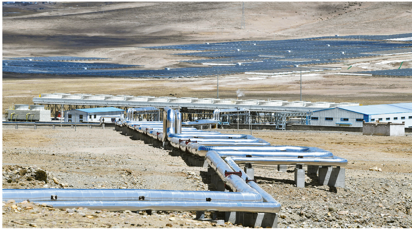
羊易地热电站（4月6日摄）。我国海拔最高的地热电站——羊易地热电站，从2018年9月29日投运至今，累计运行小时数达3.5万小时，累计发电突破5亿千瓦时。