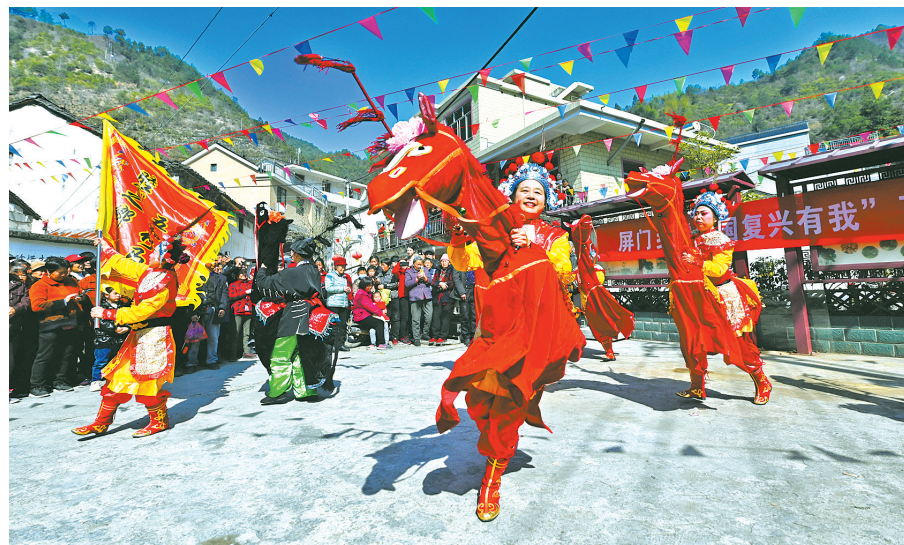
这是2023年3月10日在浙江省杭州市淳安县屏门乡屏前村传统庙会上拍摄的竹马表演。

2003年6月，浙江省启动“千村示范、万村整治”工程；从全省选择1万个左右的行政村进行全面整治，把其中1000个左右的中心村建成全面小康示范村。二十年来，“千万工程”深刻改变了浙江乡村面貌，造就了万千美丽乡村，引领浙江山乡巨变。“千万工程”也为浙江高质量发展建设共同富裕示范区打下坚实基础。