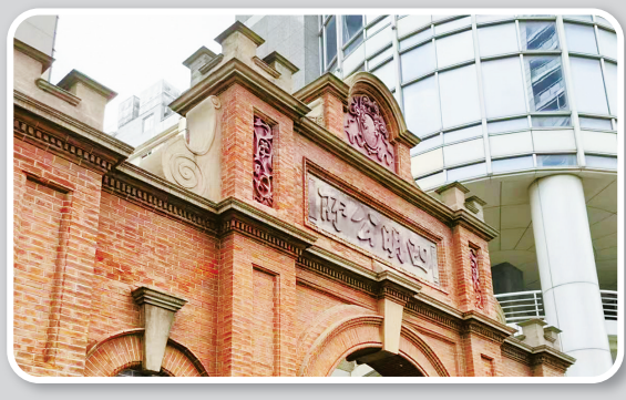
▲上海人民路830号四明公所门楼。