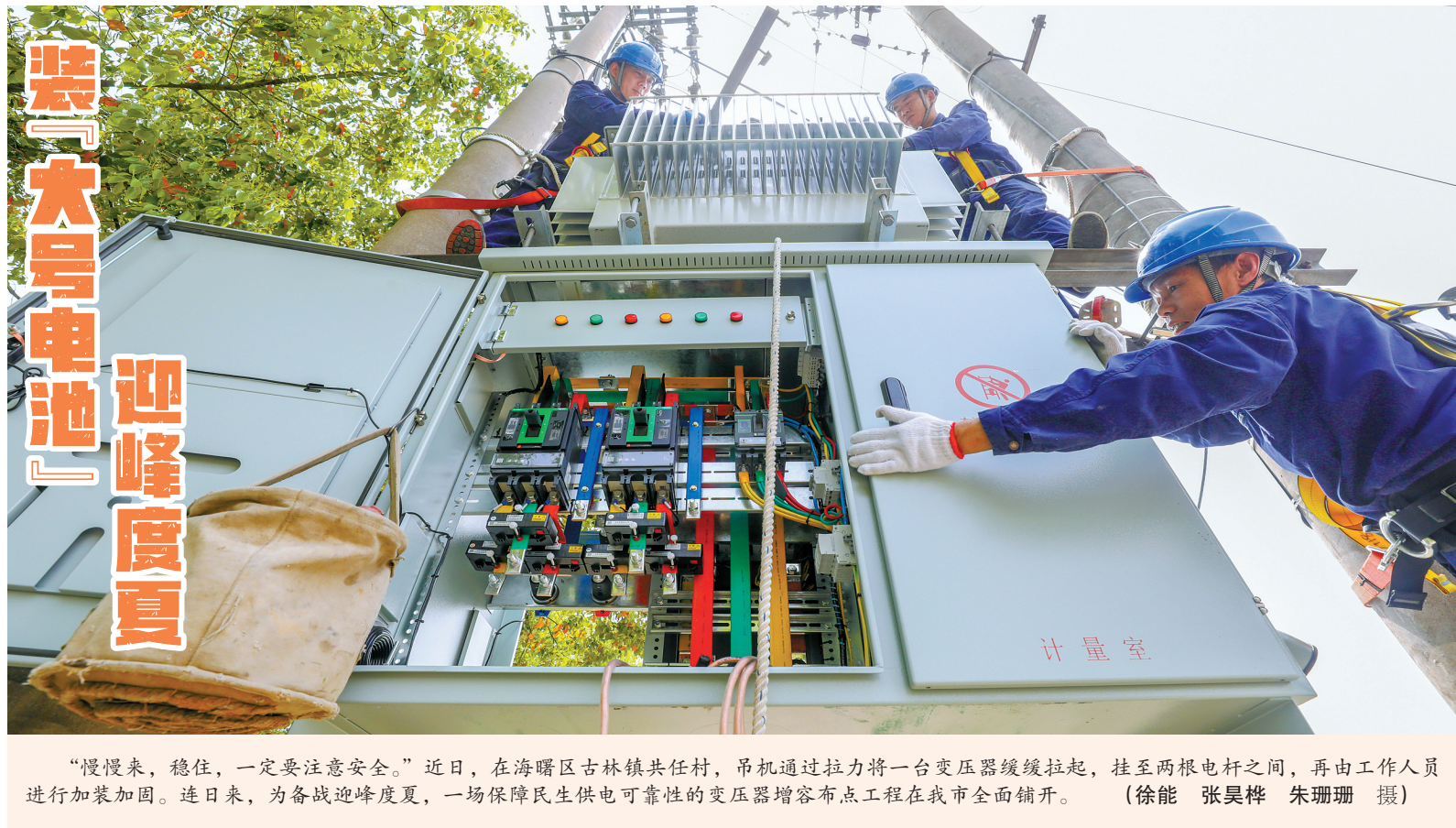
“慢慢来，稳住，一定要注意安全。”近日，在海曙区古林镇共任村，吊机通过拉力将一台变压器缓缓拉起，挂至两根电杆之间，再由工作人员进行加装加固。连日来，为备战迎峰度夏，一场保障民生供电可靠性的变压器增容布点工程在我市全面铺开。（徐能 张昊桦 朱珊珊 摄）

门，成了当地干部群众了解国家大政方针、解决百姓鸡毛蒜皮小事的重要场所，为我市建设善治和美乡村发挥了重要的作用。 随着社会的进步、经济的发展，新情况、新问题、新矛盾不断出现，比如像征地补偿、拆迁安置、企业改制等引发的社会矛盾纠纷，一旦没有及时处理好，日积月累，极易引发群体性事件。化解这些矛盾纠纷，传统意义上的部门“单打独斗”、手段单一的矛盾纠纷调解方式确实难以奏效，无法适应新形势的需要，只有构建“大调解”体系，举多方之力，聚多方合力，才能及时有效地调处化解。 “和邻小院”，调解的是矛盾，调顺的是民心，调稳的是执政根基，广大基层组织和基层干部只要切实关心群众疾苦，倾听群众心声，解决实际问题，从简单的事情做起，从细微之处着手，把社会纠纷化解当作头等大事来做，农村才能和谐，国家才能稳定。 （欢迎投稿，来稿请发民生邮箱1871684667@qq.com）