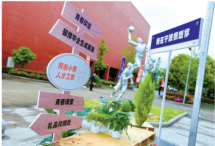
阿谷小雨人才之家。

“新材料产业看宁波，做新材料来宁波！欢迎海内外人才加入我们，求科学之真，感材料之