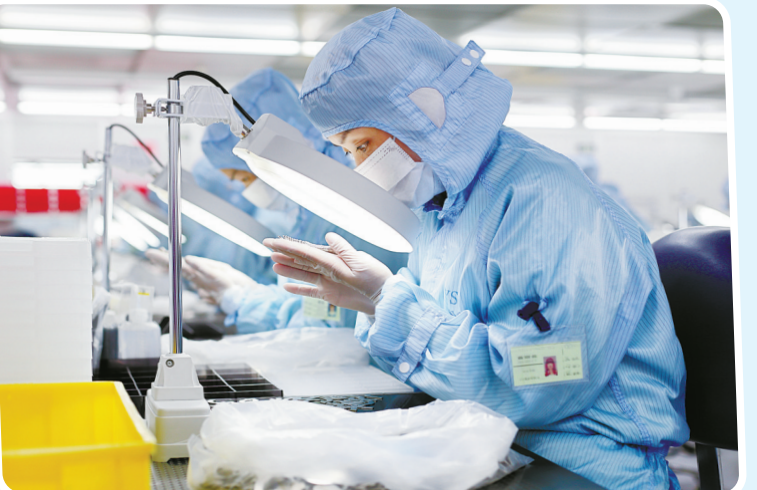
▲韵升集团坚持自主创新，把硬盘音圈电机磁体做成了“国字号”单项冠军产品。图为企业磁钢检包车间。