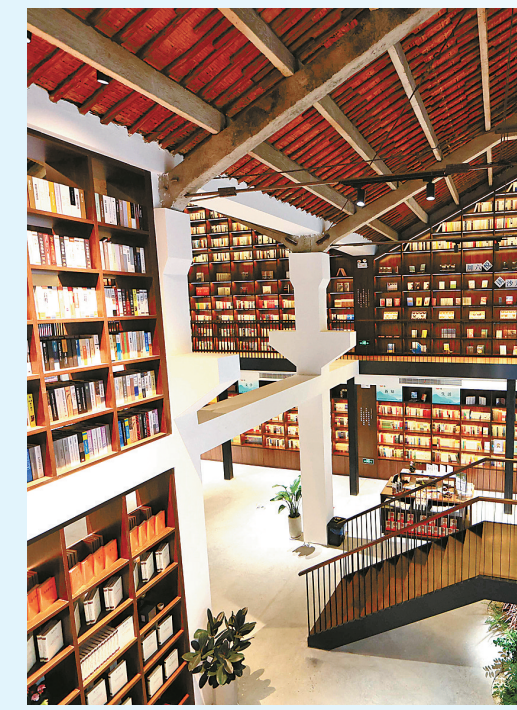
宋韵书房在东吴镇天童老街落成，让更多市民沉浸式感受宋韵文化。

“鄞州将深入贯彻落实习近平总书记对浙江、宁波工作重要指示批示精神，全面对标对表习近平同志在浙江工作期间对鄞州的重要嘱托，以‘八八战略’实施20周年为契机，精心谋划新征程上鄞州深入实施‘八八战略’的新思路，强力推进创新深化、改革攻坚、开放提升的新路径，服务宁波‘打造一流城市、跻身第一方阵’的新举措，以高质量首善之区争当中国式现代化区域示范。”鄞州区委主要负责人说。