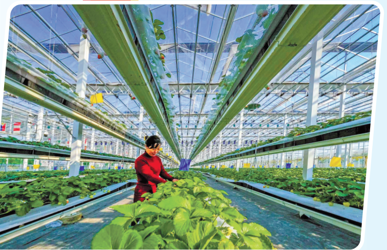
▲湾底村多年来走出了一条农旅融合发展村民致富之路。图为湾底村天庄庄园。

在鄞州，“产村融合”的村庄经营发展新格局加速形成。鄞州坚持产业为基，把发展壮大村级集体经济和增收富民放在突出的位置，因地制宜培育文旅、电商物流等新业态，积极探索闲置农房激活利用路径、村民“家门口”就业，推进“美丽资源”向“美丽经济”转化，谱写乡村振兴的共富乐章。