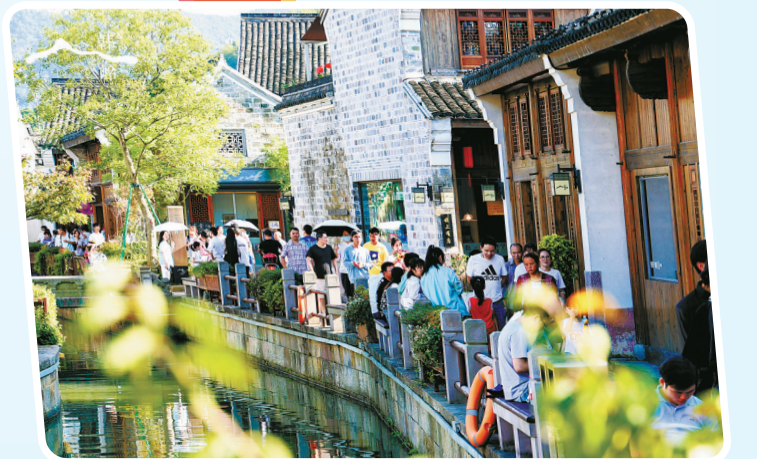
▲鄞州推进“美丽资源”向“美丽经济”转化，谱写乡村振兴的共富乐章。图为韩岭村老街游客如织。去年韩岭村旅游产值收入4亿元。

在鄞州，湖光山色传承千年文脉，典雅宋韵流淌时代乐章，生态美丽的脚步穿城入乡，绿色低碳成为鄞州发展最美的底色。