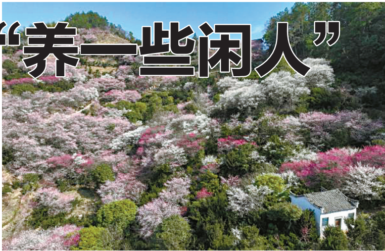
安徽省黄山市歙县卖花渔村的梅花（无人机拍摄）。