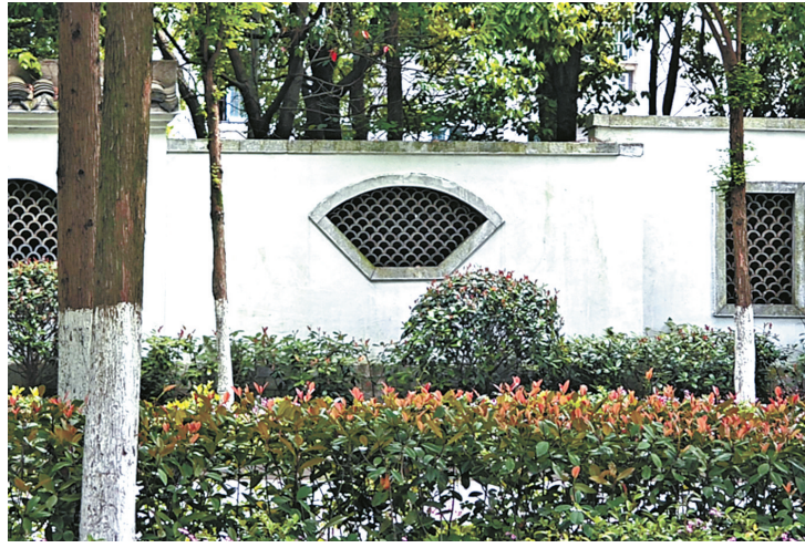
小区北面围墙外侧。