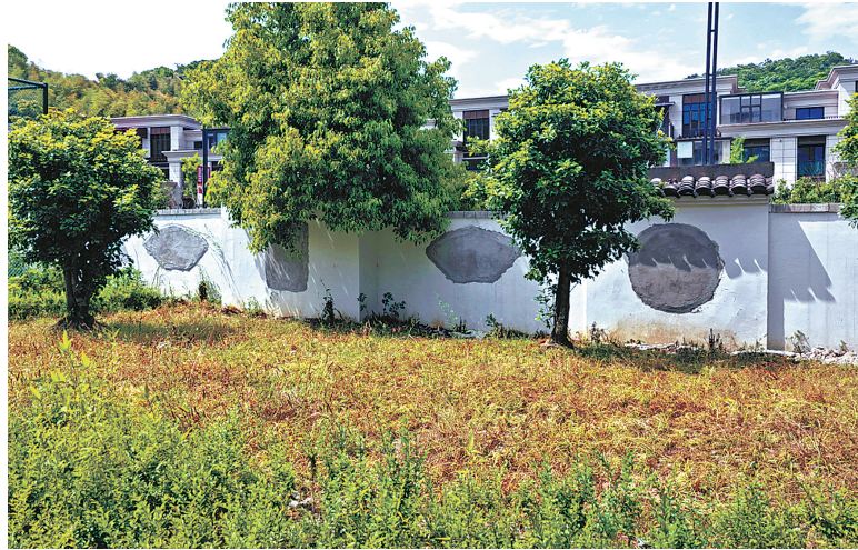
北面围墙内侧，窗孔已用水泥封住。