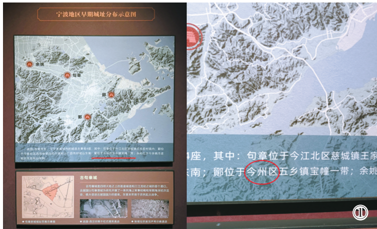
图为网友指出的几处错误(①图引自网友帖文,②图为记者方琴摄)。