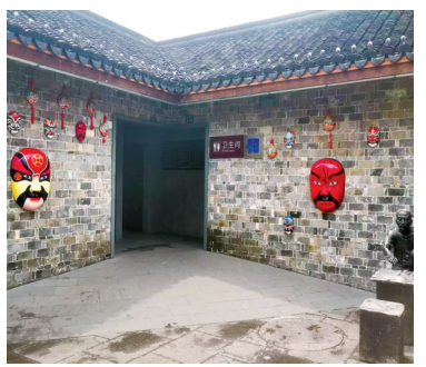
美食街南区新建一处公厕。