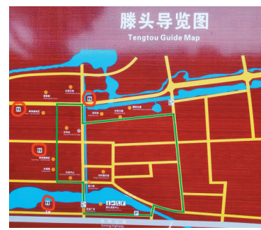
景区导览图已更新，标注了4处公厕位置。