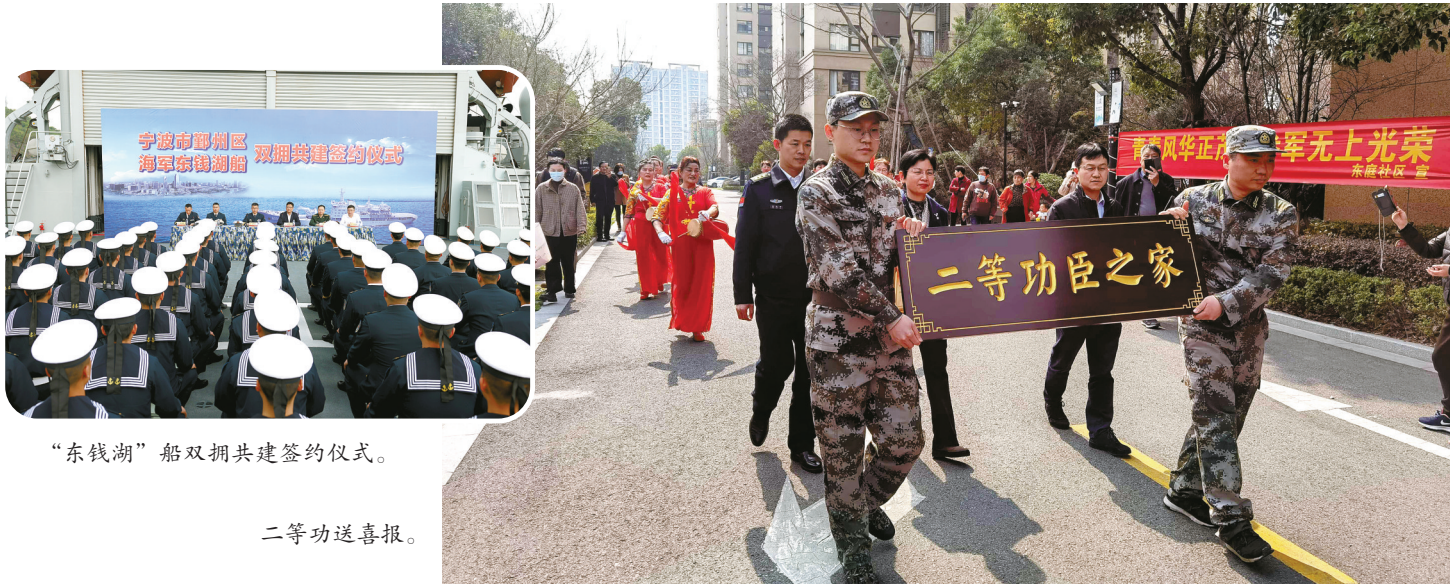
“东钱湖”船双拥共建签约仪式。