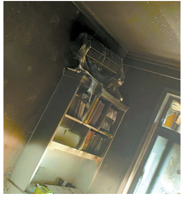
今年正月初八的火灾让居民家中遭到破坏。