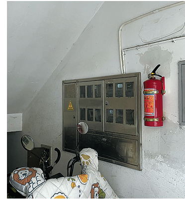
每个单元楼只在1楼配备了一个灭火器。