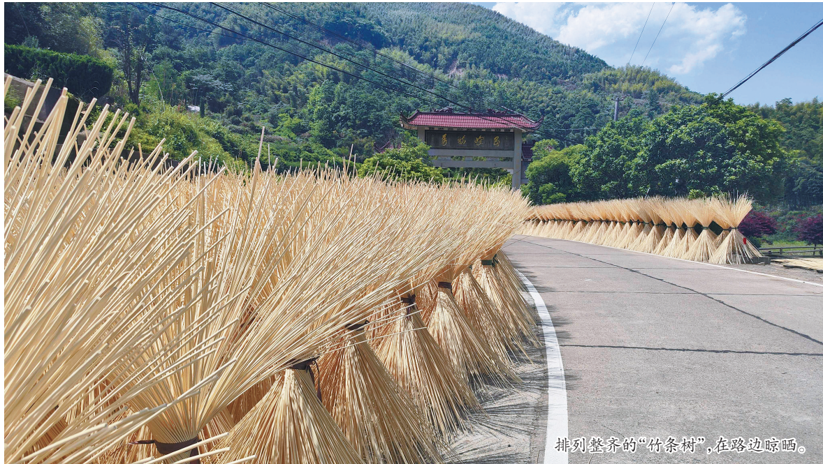
排列整齐的“竹条树”,在路边晾晒。

每年,连山毛竹合作社要“吃”掉1500余万公斤毛竹。收购的毛竹,除了来自大堰区域,还包