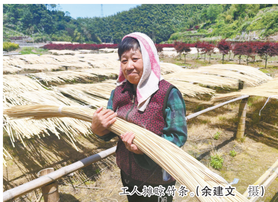
工人晾晒竹条。

括宁海深甽、新昌小将等附近乡镇,收购毛竹、人工支出等成本在1000万元左右,对竹乡的村民来说,这是一笔很可观的收入。