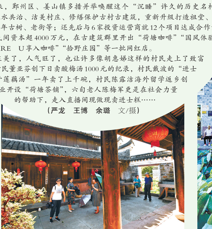
可能是天气变热的原由，上午8点刚过，村里迎来了第一批游客。