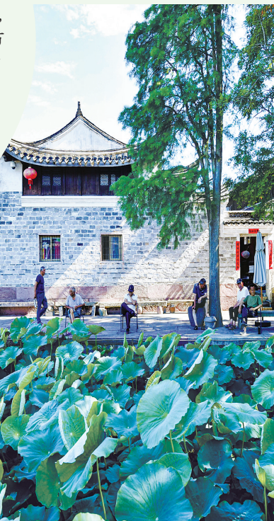
村里的老人在树荫下悠闲地聊着家常。