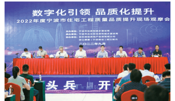
2022年住宅工程质量品质提升观摩会活动现场

事实上，在宁波楼市的每一次行业升级、每一次人居进阶、每一次城市焕新的浪潮中，都能看到绿城的身影。入甬19年来，绿城已陆续在宁波市六区、余姚、慈溪、象山等地布局了60余个项目，产品业态多样化，并连续三年问鼎宁波房企流量、权益、全口径TOP1（数据来源克而瑞），蝉联城市居民居住满意度、客户忠诚度TOP1（数据来源中指院），多次承办政府“工程质量月”活动，在参与城市共建的过程中，不断向外界展示具有引领性和影响力的绿城“样板引领”硬实力。