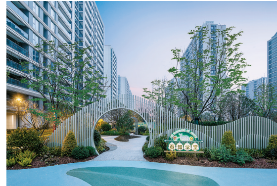
余姚春澜璟园春知学堂实景图

在这些交付项目中，绿城不仅能做到按时或提前交付，还在社区品质上始终如一地坚持产品力兑现，不断完善进步，为用户提交了满意的答卷。