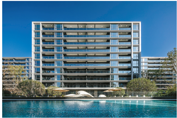
宁波春晓潮鸣交付实景

聚焦宁波楼市，眼下各大房企的交付情况，都被放在聚光灯下进行严格审视。绿城这个行内公认的尖子生，2022年在宁波完成了7000+户交付，所呈现的产品力，也受到了业主和业界的双重认可。