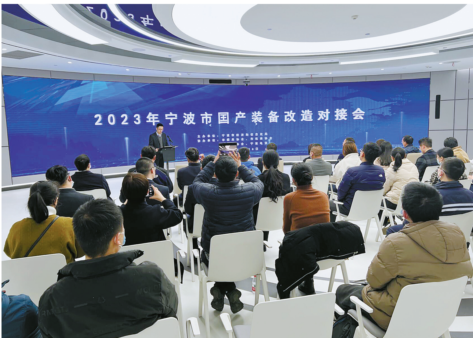
国产装备对接进一步夯实了本地产业链配套。

比如，我市将加强设备更新改造对接。我市已制定发布宁波市整机（成套）装备产品推荐目录和全市技术改造项目计划。组织企业进重点装备企业，加深对装备产品的深入了解。聚焦数控加工中心、注塑机械、压铸机械、行业专用成套设备等领域，开展整机装备生产企业和技术改造企业专项对接活动，推进供需精准匹配。支持企业加大技术改造投入，分行业举办设备更新改造政策宣讲会，鼓励链主型龙头企业联合上下游核心配套企业一同实施设备更新、机器换人、生产换线。