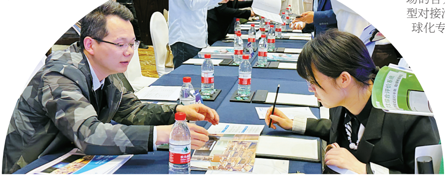
首次系列对接活动聚焦政府国企采购对接。

日日行，不怕千万里；常常做，不怕千万事。按照计划，下一步，全市经信部门将推动学习贯彻习近平新时代中国特色社会主义思想主题教育走深走实，扎实做好调研服务工作，第一时间推动惠企政策落地落实，千方百计为企业排忧解难，增强企业信心和预期。