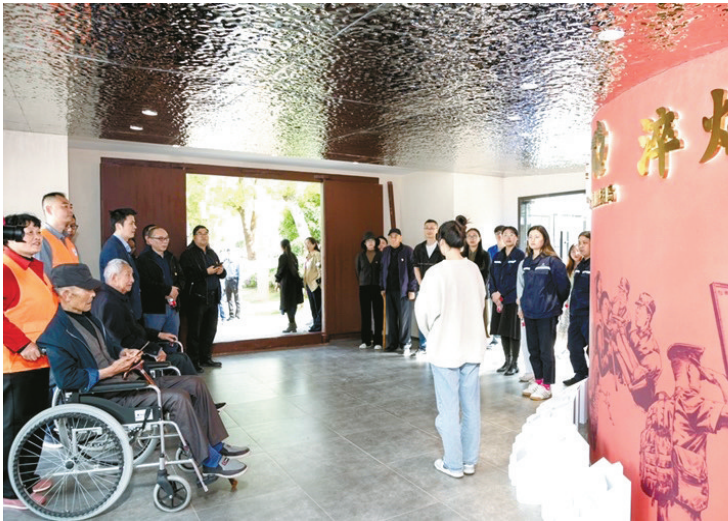
军民共同参观大榭岛双拥展览馆