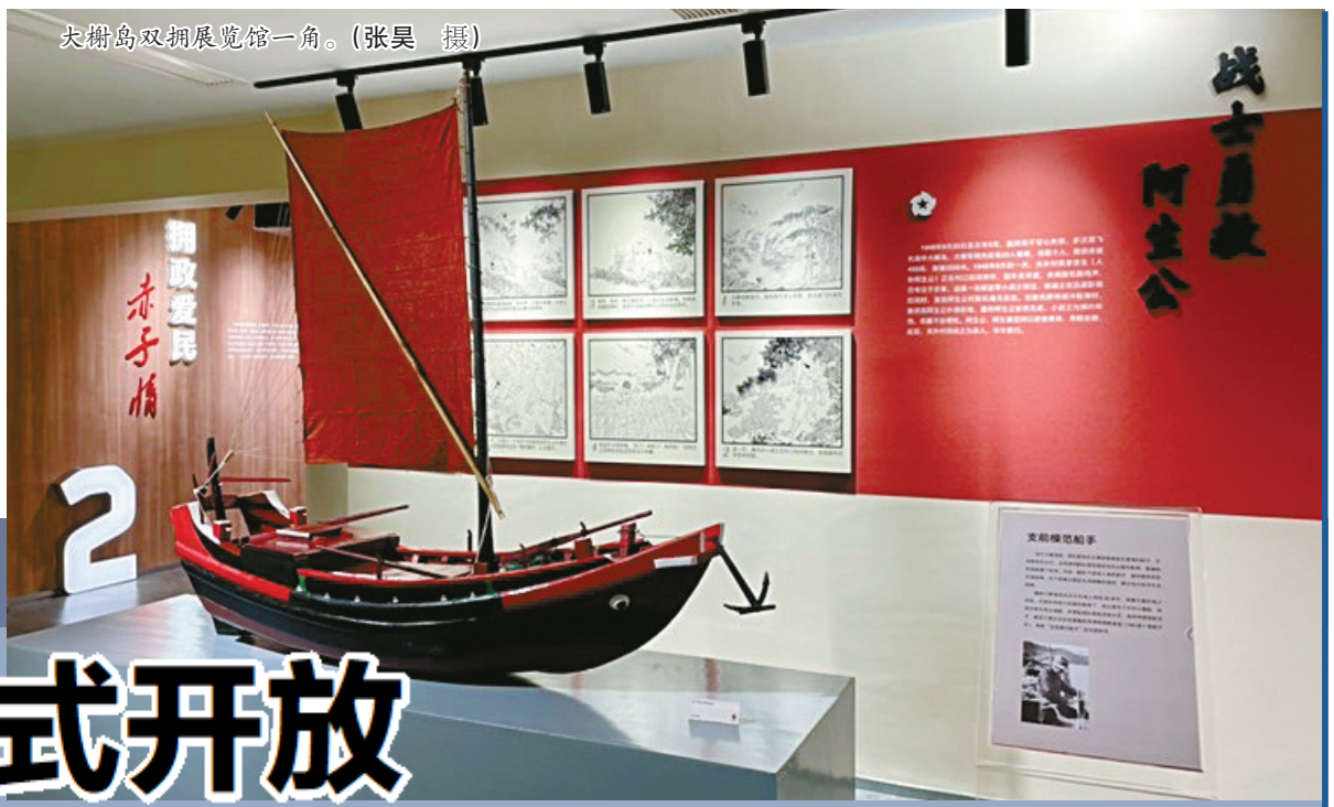
大榭岛双拥展览馆一角。